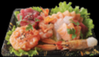
Box 5 / Solo crudo