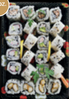
Box 8 / Roll misto