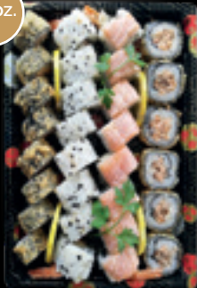
Box 9 / Sushi fritto