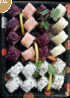
Box 6 / Ura cotto