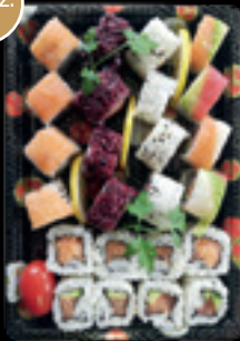
Box 7 / Ura crudo